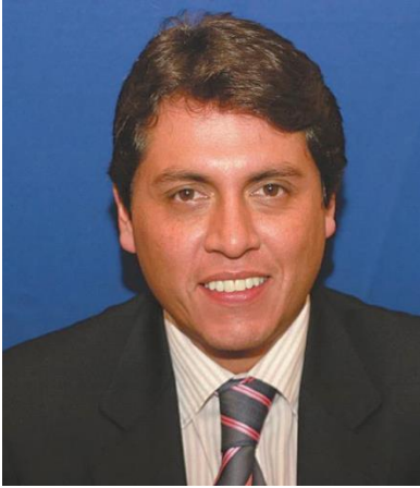
Bernard Osvaldo Gutiérrez Sanz

Bernard Osvaldo Gutiérrez Sanz es un político boliviano, actualmente Senador Nacional por el Departamento de Cochabamba, con mandato constitucional hasta el 22 de enero de 2015.